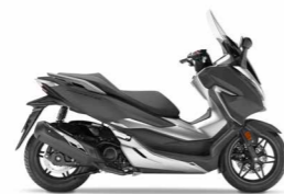
Matt Cynos Grey Metallic