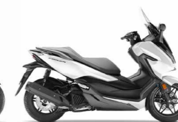
Matt Pearl Cool White