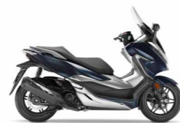
Crescent Blue Metallic