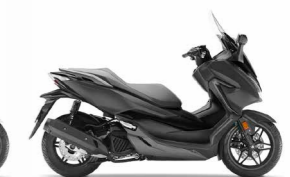
Matt Cynos Grey Black