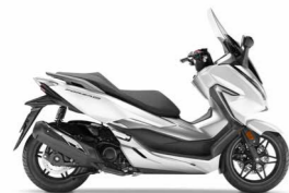
Matt Pearl Cool White