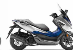
Lucent Silver Metallic / Matt Pearl Pacific Blue