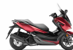
Pearl Splendour Red