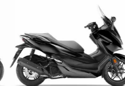
Pearl Nightstar Black